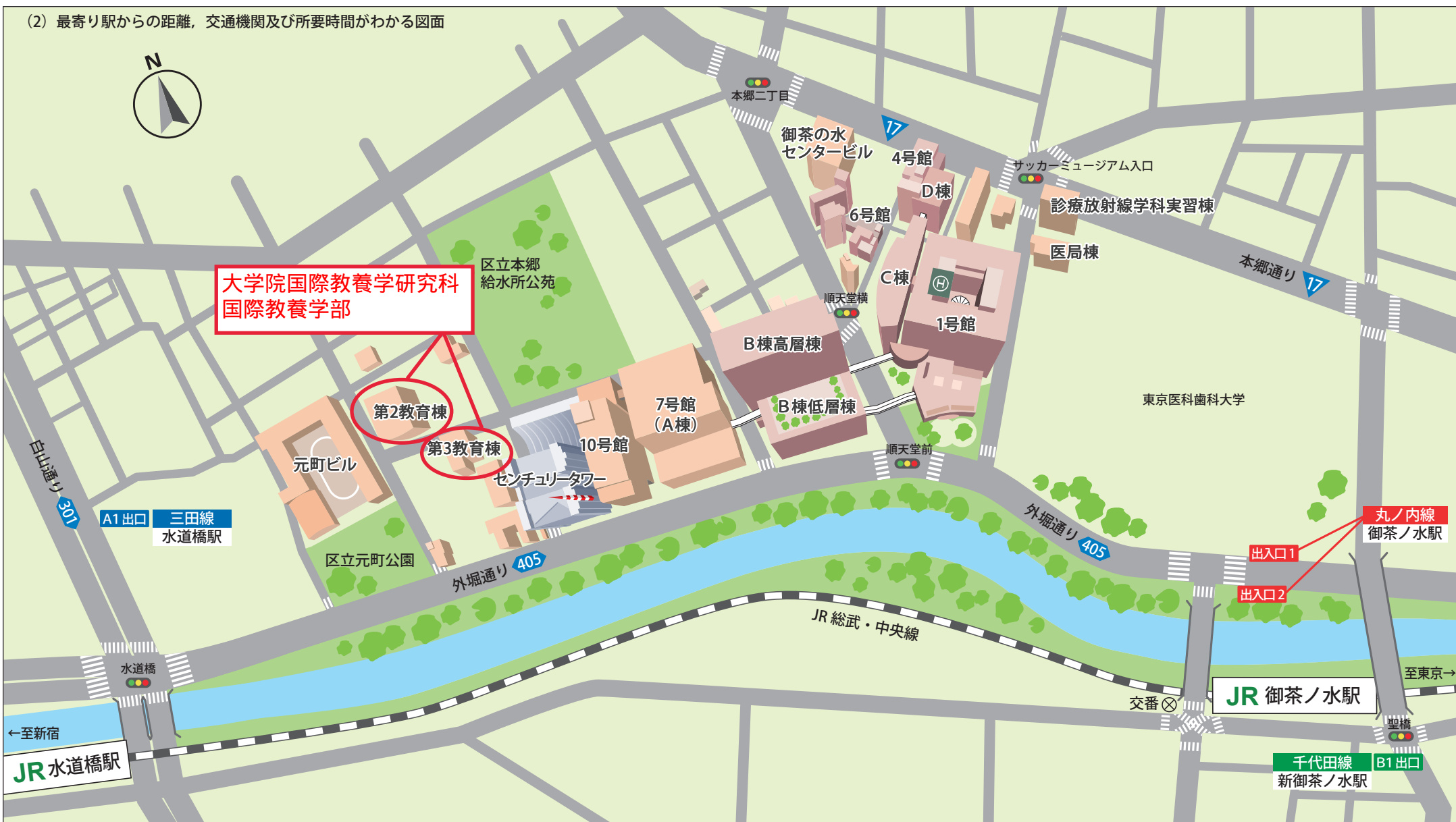
(2) 最寄り駅からの距離、交通機関及び所要時間がわかる図面