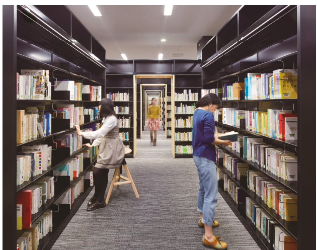
2階「ブックスケープ」は、従来型の書架ではなく、本の森に迷い込んで思いがけない本とも出会うという意図を込めた配置に