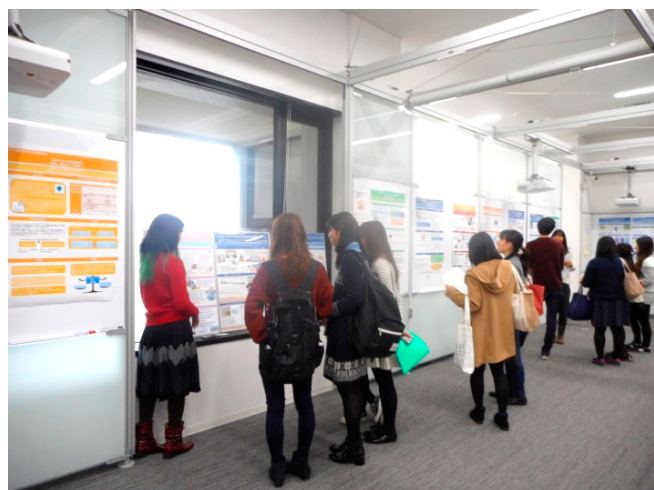
1 階アクティブコモンズ内の「ワークショップエリア」で行われた卒論発表会のポスターセッション