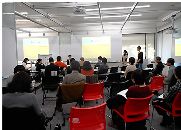
1階アクティブコモンズ内の「ワークショップエリア」で行われた「書評コミュニケーションゲーム」ピリオバトル