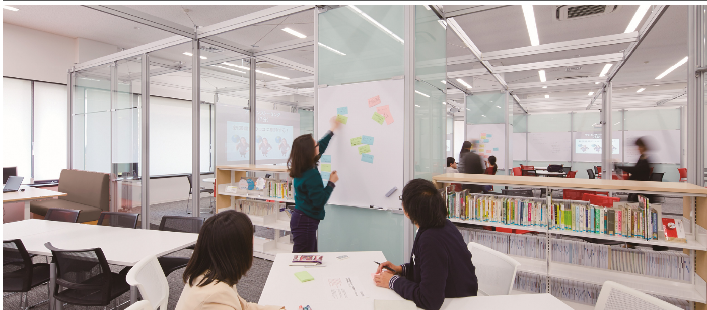
1階の大部分を占める「アクティブコモンズ」には、グループワークのために、大小のホワイトボード、プロジェクタ、可動式什器等を整備